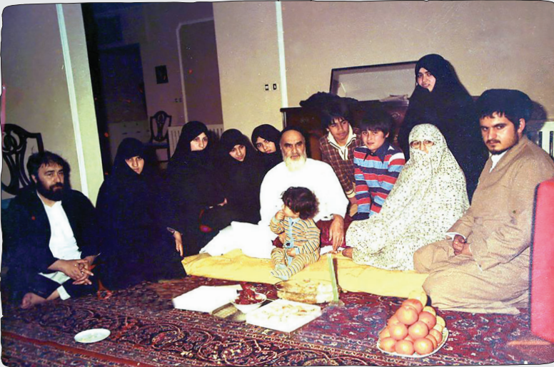
تصاویر مهم تاریخی از امام خمینی (س) به همراه توضیح

هنری کیسینجر، استراتژیست و مشاور رئیس جمهور سابق آمریکا، درباره وجود الهام الهی در تصمیمات امام خمینی (س) گفته است: «آیت الله خمینی، غرب را با بحران جدی برنامه ریزی مواجه کرد. هیچ کس نمی توانست تصمیمات او را از پیش حدس بزند. او با معیارهایی غیر از معیارهای شناخته شده در دنیا سخن می گفت و عمل می کرد؛ گویی از جایی دیگر الهام می گرفت. دشمنی آیت الله خمینی (س) با غرب، برگرفته از تعالیم الهی او بود. او در دشمنی خود نیز خلوص نیت داشت.» امام (س) در برابر نظام محاسباتی قدرت های غربی، الگویی متفاوت و پیش بینی ناپذیر ارائه کرد؛ الگویی که بر ایمان، استقلال، تکلیف گرایی و باور دینی استوار بود.