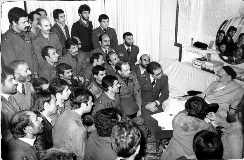
تصاویر مهم تاریخی از امام خمینی (س) به همراه توضیح

این تعبیر گورباچف، رهبر آخرین سال‌های اتحاد جماهیر شوروی، نشان دهنده درکی عمیق از جایگاه تاریخی امام خمینی (س) است؛ رهبری که نگاه او تنها محدود به یک جغرافیا یا یک مقطع زمانی نبود، بلکه افق اندیشه‌اش تحولات جهان معاصر را تحت تأثیر قرار داد.