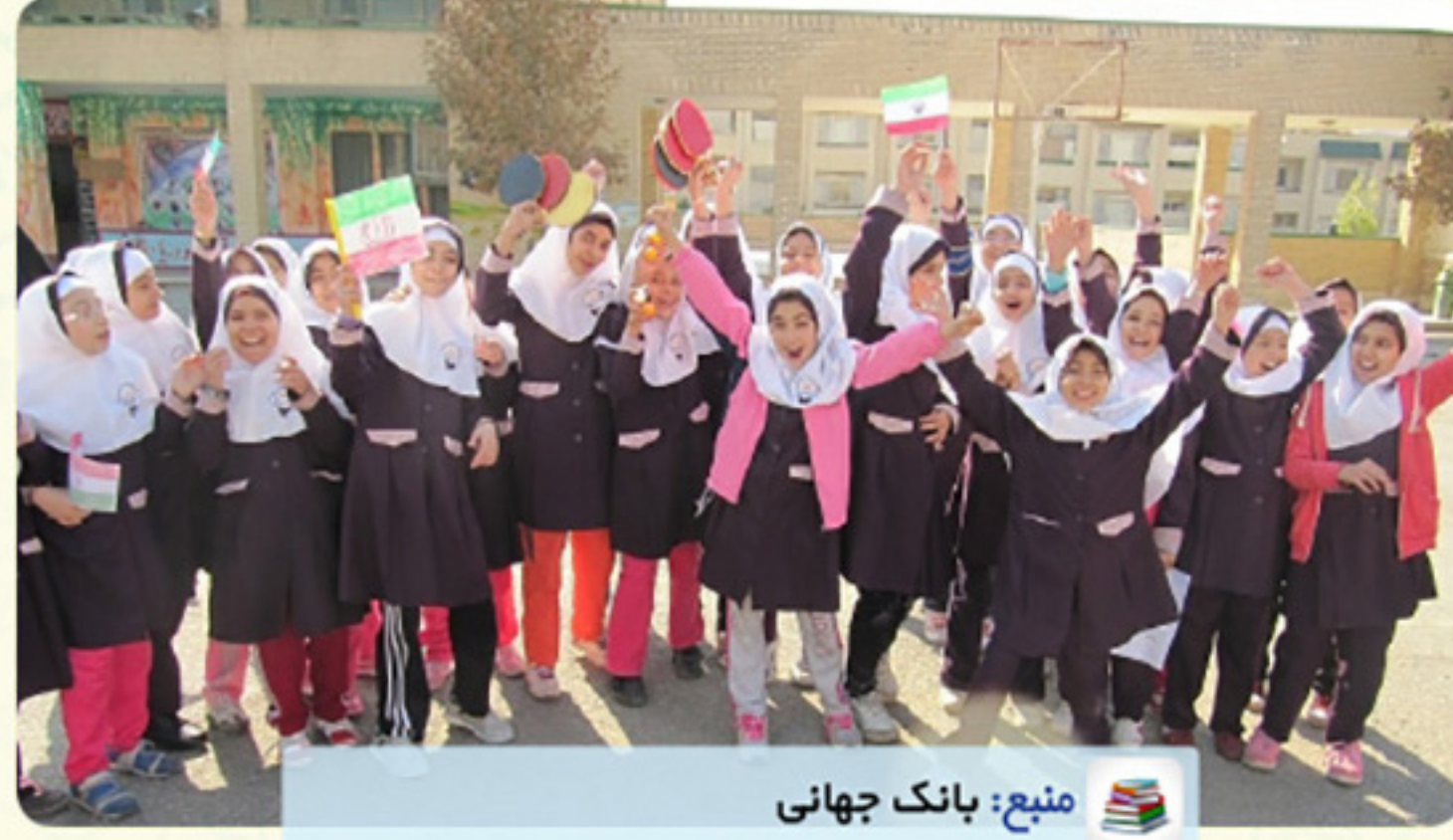
منبع: بانک جهانی

میزان بودجه آموزش پرورش به عنوان درصد از کل بودجه دولت: نوزدهم تعداد دانش‌آموزان دوره ابتدایی: هفدهم تعداد دانش‌آموزان دوره دبیرستان: هشتم