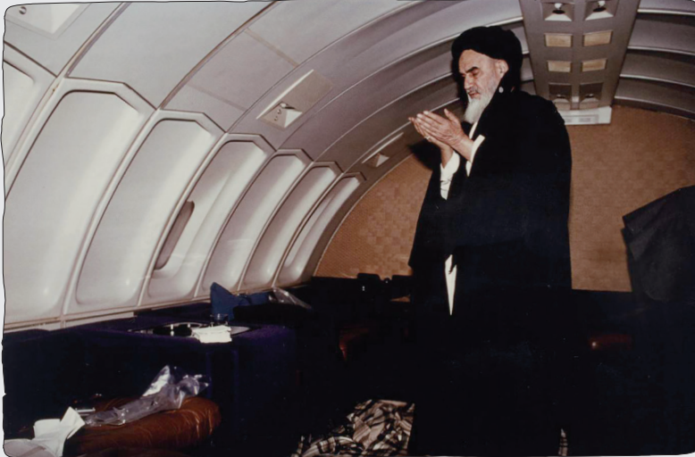
تصاویر مهم تاریخی از امام خمینی (س) به همراه توضیح

آلویس تافلر، استراتژیست آمریکایی، در تحلیل کنش های سیاسی امام خمینی (س) گفته است: «وقتی آیت الله خمینی فتوای قتل سلمان رشدی را صادر کرد، در واقع برای حکومت های دنیا پیامی تاریخی فرستاد که بسیاری از دریافت و تحلیل آن عاجز ماندند. مضمون واقعی پیام امام چیزی نبود مگر فرارسیدن عصری جدید از حاکمیت جهانی؛ عصری که غربی ها باید آن را با دقت مورد توجه و بررسی قرار دهند. زیرا در ادامه حرکت امام خمینی (س)، قلمرو اندیشه های بشری، جایگاه حکومت های دولتی و اقتدار دولت های ملی و محلی را تغییر می دهد.» تافلر، حرکت امام را نشانه ای از ورود جهان به مرحله ای تازه در مناسبات قدرت، اندیشه و حاکمیت می داند.